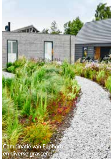
Combinatie van Euphorbia en diverse grassen.