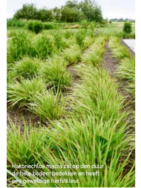
Hakonechloa macra zal op den duur de hele bodem bedekken en heeft een geweldige herfstkleur.