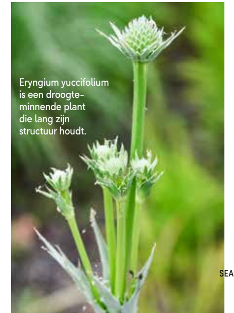
Eryngium yuccifolium is een droogte-minnende plant die lang zijn structuur houdt.