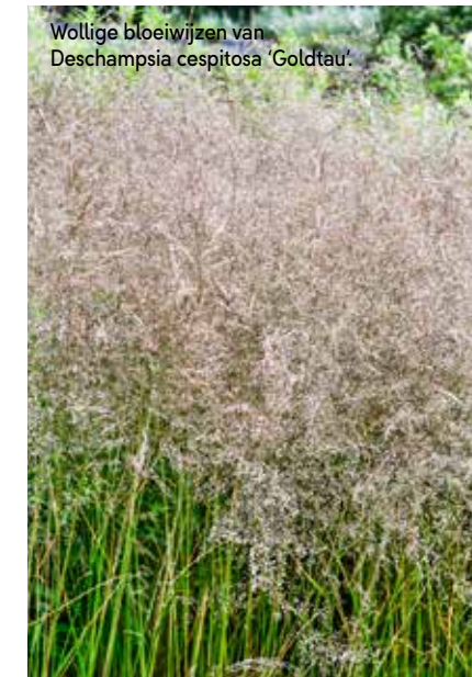
Wollige bloeiwijzen van Deschampsia cespitosa 'Goldtau'.