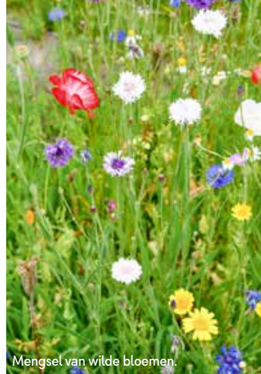
Mengsel van wilde bloemen.