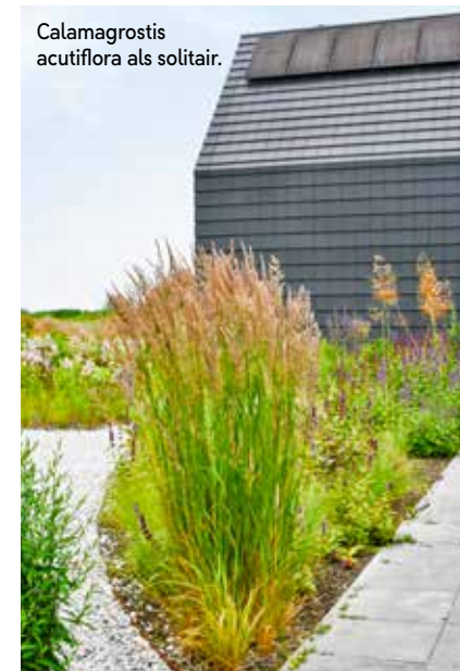
Calamagrostis acutiflora als solitair.

Op het terras kijk je op de purperen pracht van de verbena, die een mooie overgang vormt naar het weiland