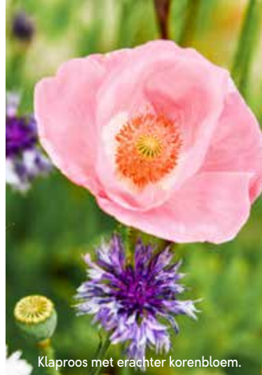
Klaproos met erachter korenbloem.