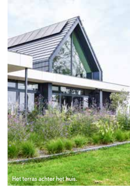
Het terras achter het huis.