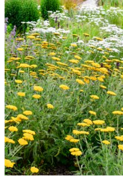
Links: Wildmengsel met o.a. Astrantia. Midden: Calamagrostis acutiflora 'Karl Foerster'. Rechts: Achillea 'Coronation Gold' met erachter Achillea ptarmica 'Perry's White'.