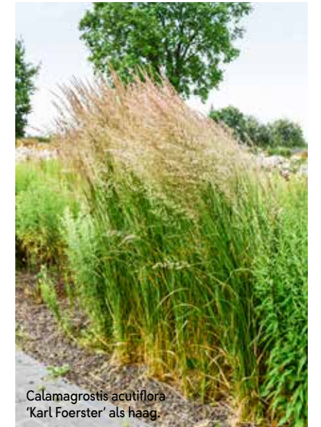
Calamagrostis acutiflora 'Karl Foerster' als haag.

Op het terras kijk je op de purperen pracht van de verbena, die een mooie overgang vormt naar het weiland