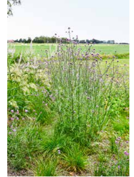
Links: Rondom groeien wilde bloemen als kattenstaart die mooi aansluiten bij de tuin. Rechts: Verbena bonariensis. Er is bewust gekozen voor een open blik naar het weidse landschap.